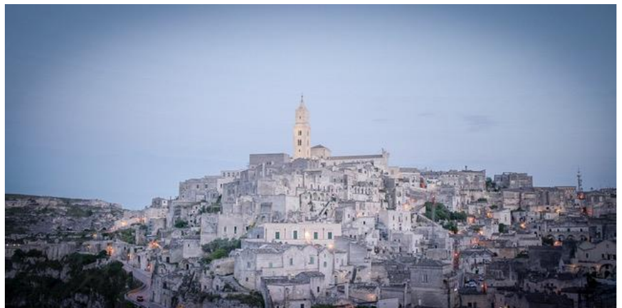
Matera, dove sono stati girati i famosi film di Pasolini e Gibson su Gesù.

Durante un primo viaggio di ricerca nel sud Italia poi sono venuto a conoscenza della realtà dei "ghetti": 500.000 persone che, incastrate dal trattato di Dublino, sono criminalizzate dall'attuale governo italiano e poi sfruttate nelle piantagioni dalla mafia e dagli agricoltori su mandato delle multinazionali del cibo e dei supermercati. Il focus del progetto si è così spostato