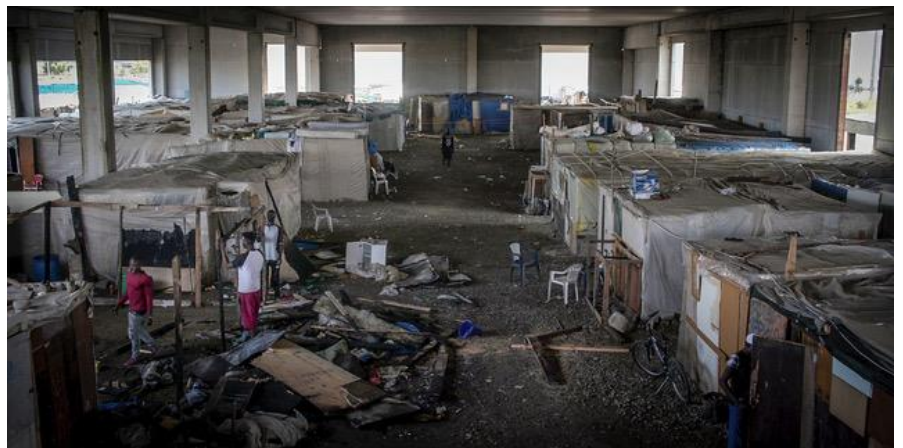
Il "ghetto" di Metaponto non è lontano da Matera in mezzo alle piantagioni di frutta.

Cristiani, musulmani, ebrei, atei, rifugiati ed europei lottano dunque insieme per il diritto di ogni persona ad una vita di legalità, autodeterminazione e libertà di movimento. Essi esortano tutti i cittadini e le cittadine d'Europa a solidarizzare con loro e a manifestare la propria indignazione e opposizione verso le